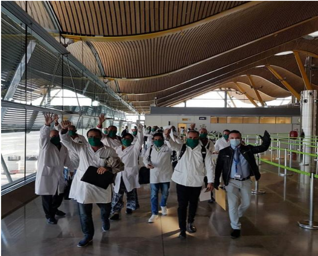
39 kubanische Ärzte treffen am 29. März in Madrid ein, um nach Andorra zu reisen.