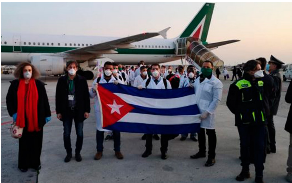
52 kubanische Ärzte treffen am 22. März 2020 in der Lombardei ein.

"All diese Opfer sind es wert, um nur ein einziges Leben zu retten", würde mir jede.r KubanerIn sagen, immer bereit, anderen Völkern zu helfen, ohne sich je in die Politik dieser Länder einzumischen und mit dem kubanischen Leitsatz : « Wir teilen, was wir haben » (und nicht : Wir teilen, was wir zu viel haben.)