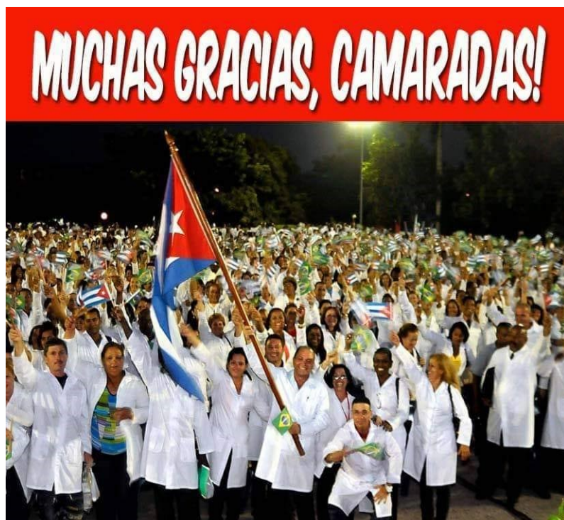
Kubanische Ärzte