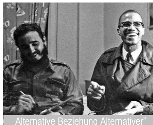
„Alternative Beziehung Alternativer“ Fidel Castro & Malcolm X (Sept. 1960, New York)

Trotz einiger Erleichterungen z.B. im Reiseverkehr und bei Geldüberweisungen die seit über einem halben Jahrhundert bestehende Wirtschafts-, Handels- und Finanzblockade der USA gegen Cuba ist nicht beendet! Betroffen davon sind auch Drittstaaten, die mit Cuba zusammenarbeiten oder Handel treiben. 191 Staaten dieser Welt forderten dies kürzlich erneut in der UN von den USA. US-Präsident Trump hat viele der Erleichterungen gestrichen und einen aggressiveren Kurs begonnen.